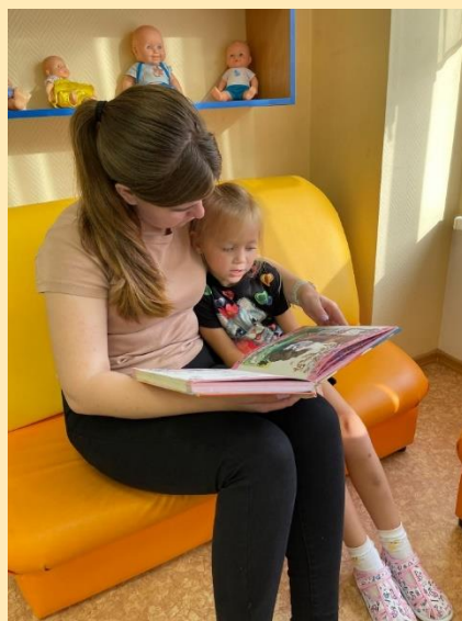
Чтение сказки К.И. Чуковского «Айболит»