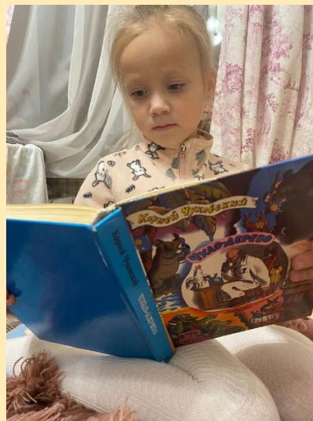
Чтение сказок К.И. Чуковского