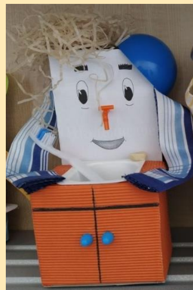
Изготовление любимого героя из сказок К.И. Чуковского