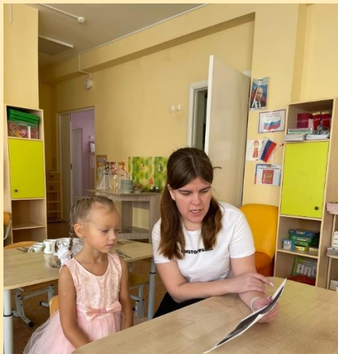
Знакомство с автором К.И. Чуковским