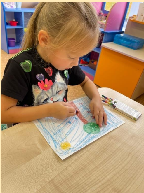
Рисование по мотивам сказок К.И. Чуковского