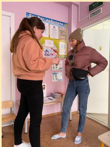
Консультация на тему «Сказки К.И. Чуковского – помощники в воспитании и развитии дошкольников»