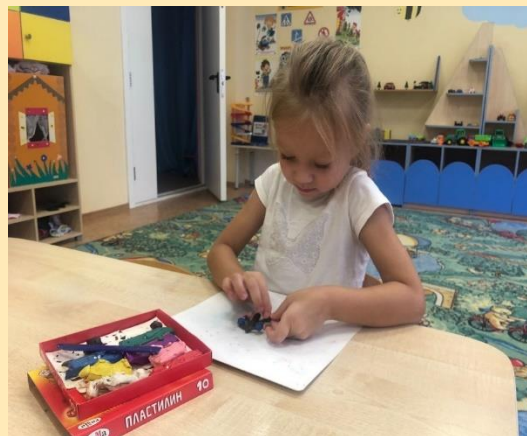
Лепка по сказке «Чудо-дерево»