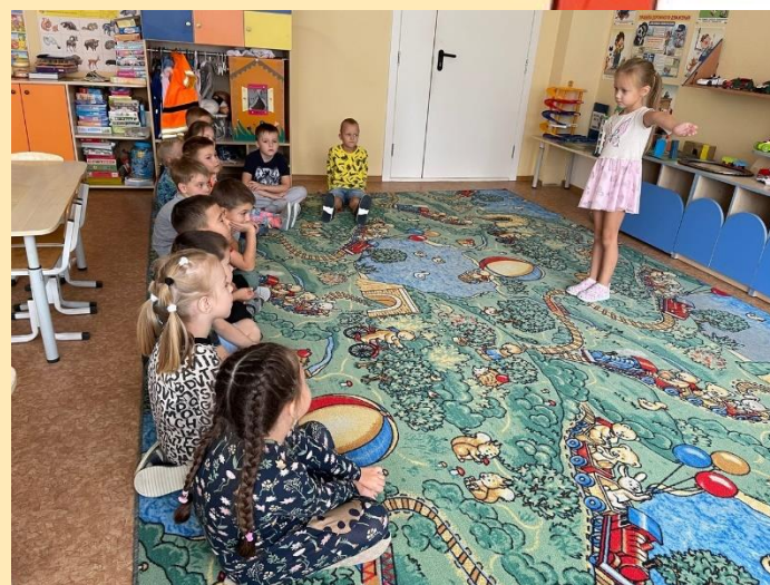
Рассказ о творчестве К.И. Чуковского