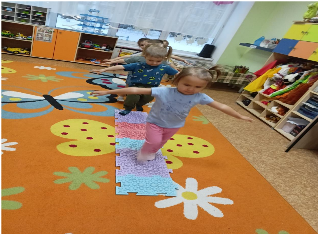
Занятия по физической культуре