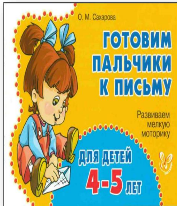
Сахарова О.М. Готовим пальчики к письму 4-5 лет