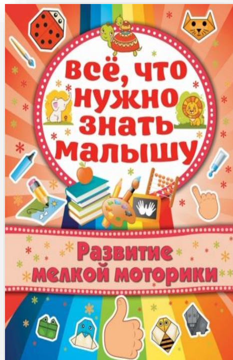
Бондарович А. Всё, что нужно знать малышу. Развитие мелкой моторики