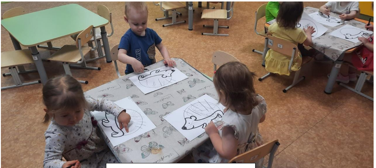
Рисование «Колбочки для ёжика»