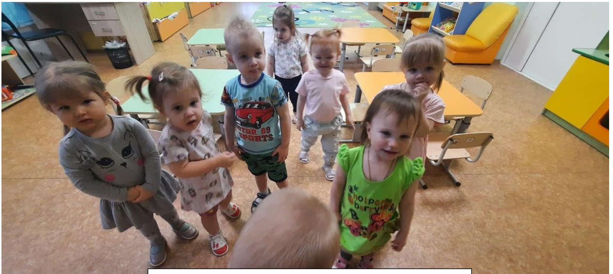
Подвижная игра «Найди яблочко для ёжика»