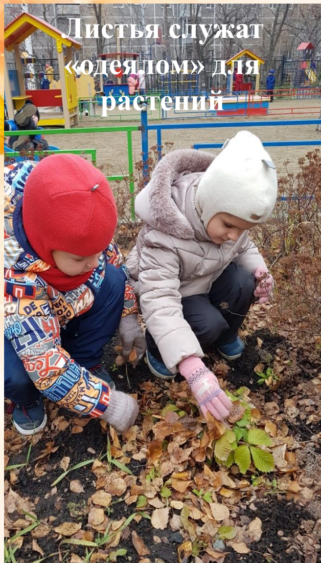
Листья служат «одеялом» для растений