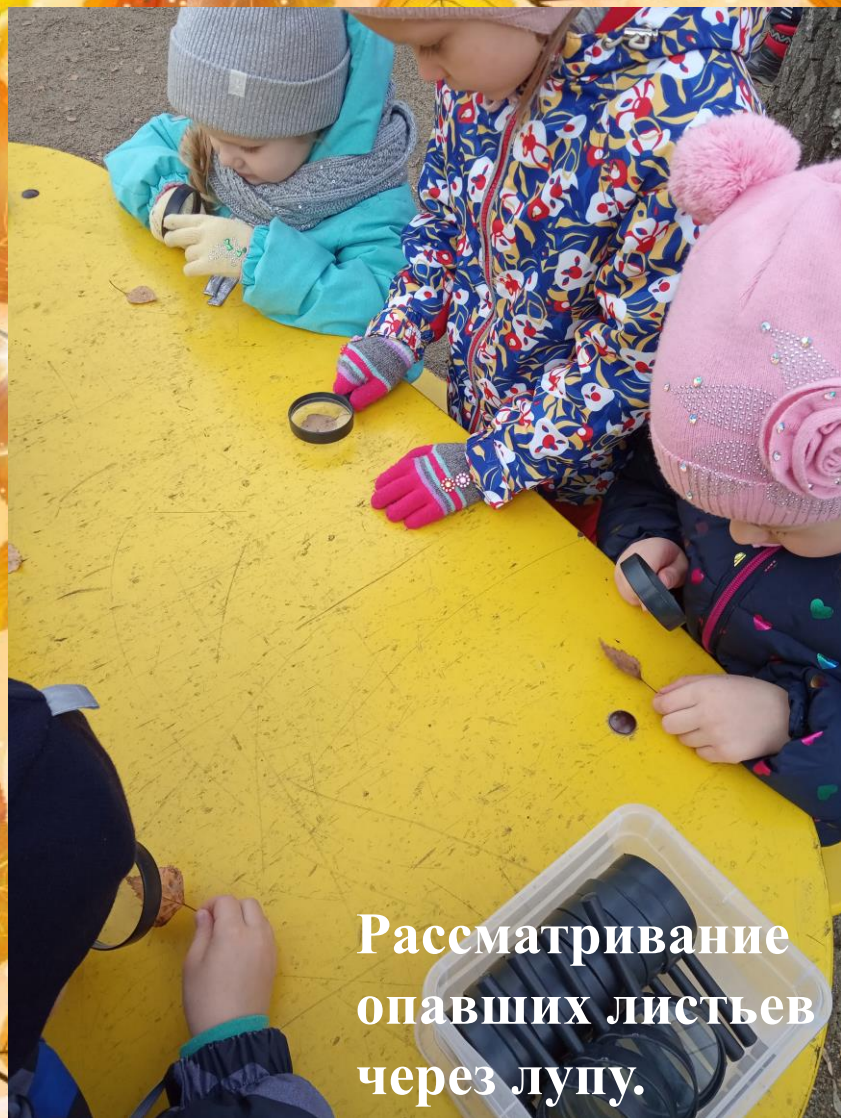
Рассматривание опавших листьев через лупу.