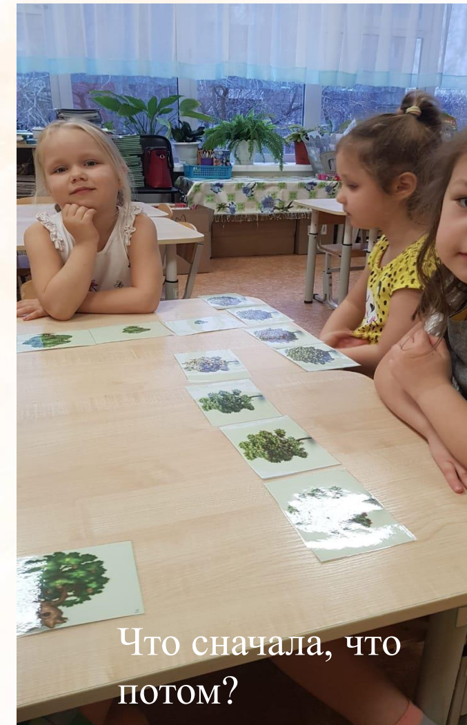
Что сначала, что потом?