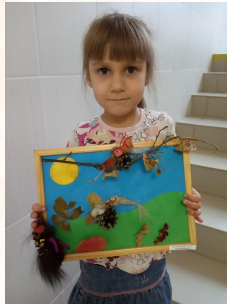
Призеры выставки детских работ «Сказки старого леса»